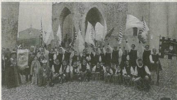
Il gruppo "Real Trinacria" Trapani-Erice.

••• I Musici e Sbandieratori "Real Trinacria" Trapani-Erice hanno entusiasmato tutti offrendo spettacolo e portando aria di festa nella giornata di domenica con due performance di grande levatura che si sono svolte di mattina nel suggestivo borgo medievale di Erice e nel pomeriggio nella frazione di Dattilo, nel Comune di Paceco. Nella città della vetta il gruppo ha "presidiato" l'appuntamento finale del XXXVmo raduno nazionale delle "Confraternite Enogastronomiche d'Italia", unite nel segno della valorizzazione delle tipicità locali di ogni regione. Dopo la celebrazione della Santa Messa nella Chiesa di San Martino da parte di Monsignor Liborio Palmieri, il gruppo di Musici e Sbandieratori "Real Trinacria" ha aperto alla propria maniera ed ha accompagnato la sfilata delle trentacinque Confraternite che sono giunte in Piazza Loggia per rice-